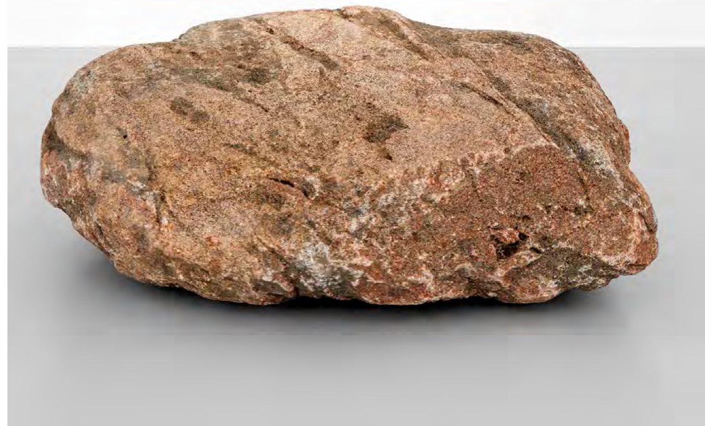
Alicja Kwade, Stellar Day , 2015, steen, motor, 60 x 100 x 115 cm. De steen draait tegen de tijd in een omwentelings-snelheid van een jaar, waardoor absolute stilstand wordt gesuggereerd.

Degrowth is tot nog toe meer een individuele, dan een institutionele ambitie