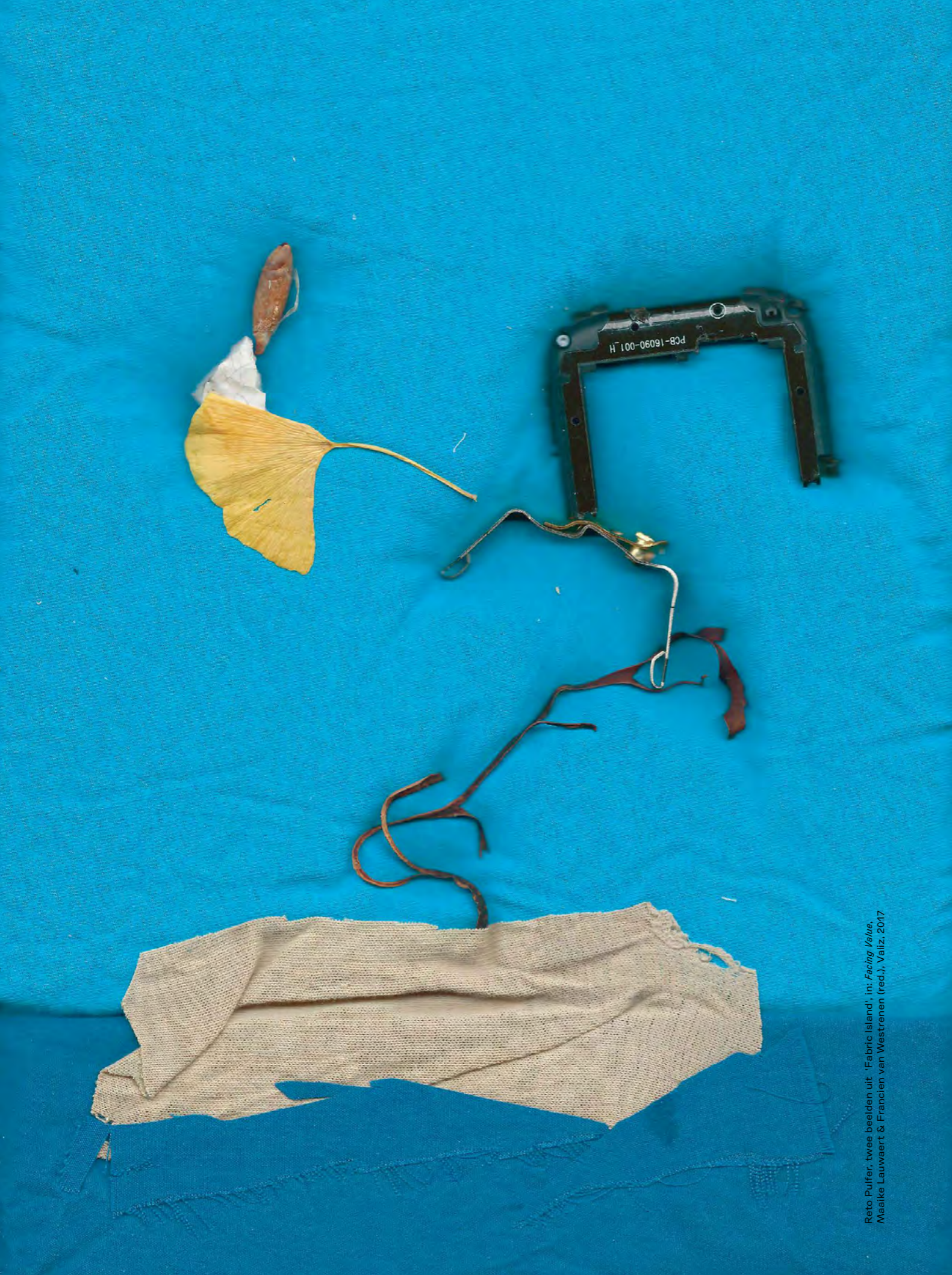
Reto Puffer, twee beelden uit 'Fabric Island', in: Facing Value , Madelke Lauwaert & Francien van Westrenen (red.), Valiz, 2017