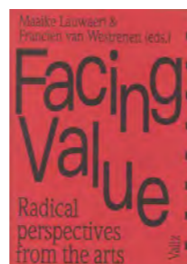
Cover Facing Value