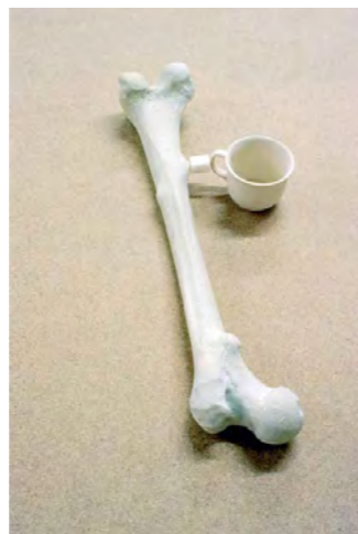
Mark Manders, A Place Where My Thoughts Are Frozen Together , 2001, geschilderd porselein, geschilderde epoxy en suikerklontje, 44 x 16 x 6,5 cm

Met name in de ontwerpwereld zijn er veel nieuwe initiatieven gericht op het vinden van een andere balans in de wereld, een die niet uitgaat van continue groei maar van een duurzame samenleving. Ontwerper en curator Ester van de Wiel, verbonden aan de Design Academy Eindhoven, opereert in haar vrije praktijk op het gebied van stedelijke (her-)ontwik-