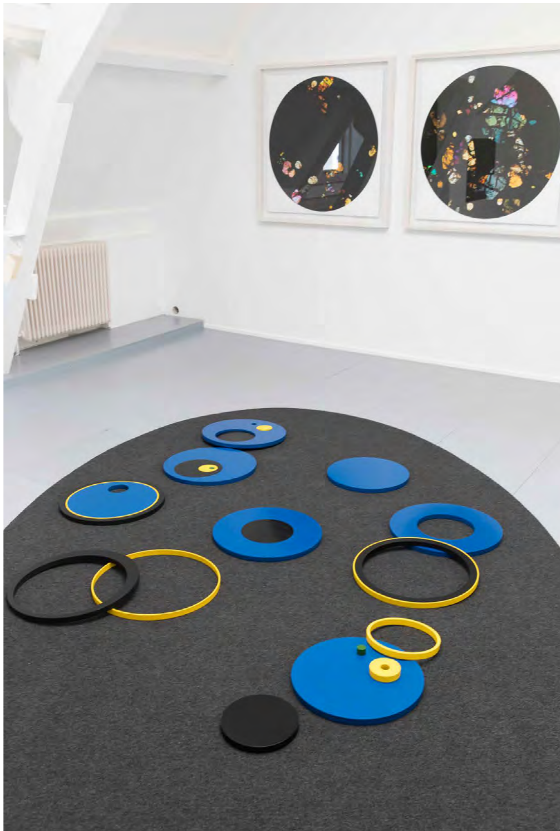
Marjolijn Dijkman, Composition of the Universe , 2011, geschil- derde houten vormen, vloerkleed en Guillermo Falovich en Nicolás Goldberg, Número-reeks , 2015, pigmentdruk op pa- pier van gerecycled katoen, onderdeel van Casco Art Institute: Working for the Commons bij Casco, 2017

‘Slow down, think more and self-reflexively, and then think and act with a longer frame of time’